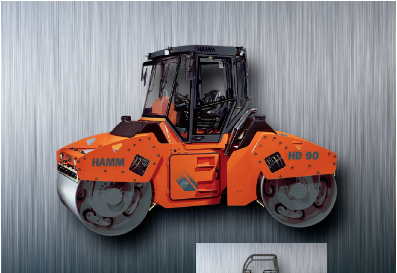
Máquina com equipamento opcional